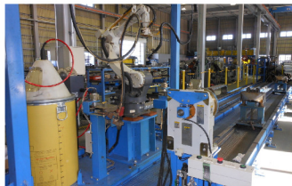
切断・溶接ロボット