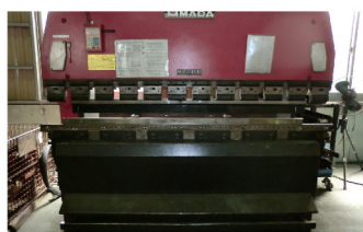
バンディングプレス