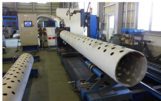
パイプコースター