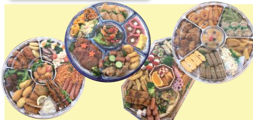
↑オードブルは、市内の障がい者就労事業所 4 事業所へご依頼しました。 受け取られた皆さん大変喜ばれていました！ オードブルを囲んで、ほっと一息……家族団らんの素敵な時間を過ごして いただけたかと思います。