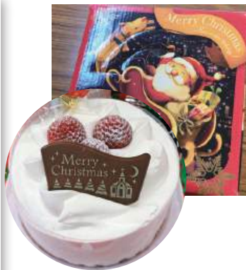
↑クリスマスケーキは プレシア福岡工場店様にご 依頼し、特別にご準備いた だきました。