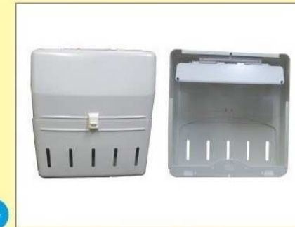
郵便受箱(片面プレス用) KD-2YS型 ¥23,600 (アイボリーホワイト)