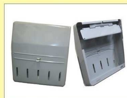
郵便受箱(片面プレス用) KD-2Y型 ¥19,600 (グレー)