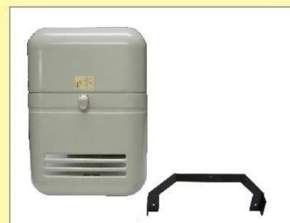
郵便受箱(両面フラッシュ用) KD-1B6型 ¥17,600 (アイボリーホワイト)