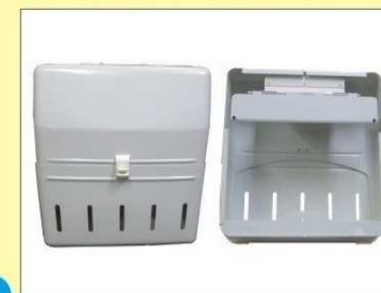
郵便受箱(両面プレス用) KD-2A改S型 ¥23,600 (アイボリーホワイト)