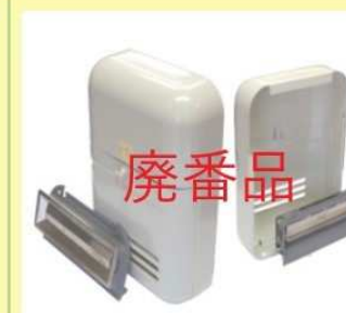
郵便受箱(両面フラッシュ用) KD-6型(セット) 廃番品