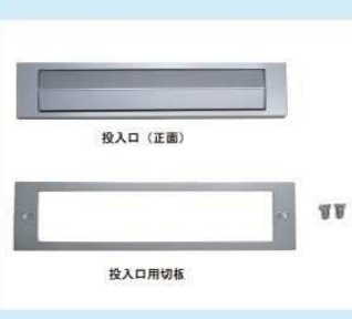
KD-3型用投入口及びプレート (サテライトクロム) ¥13,000