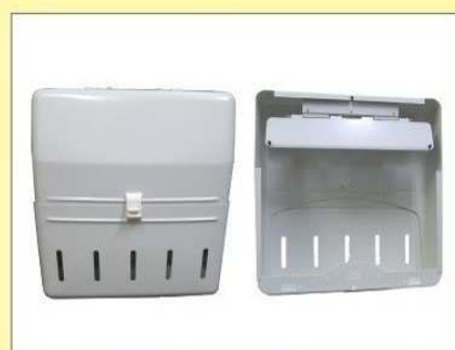
郵便受箱(片面プレス用) KD-2S型 ¥23,600 (アイボリーホワイト)