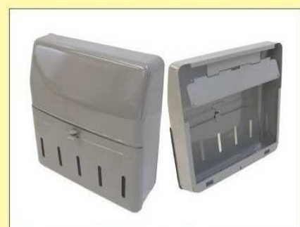
郵便受箱(片面プレス用) KD-2型 グレー ¥17,100 (グレー)(クリーム) クリーム ¥19,100