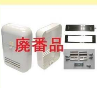
郵便受箱(両面フラッシュ用) KD-6B型(セット) 廃番品