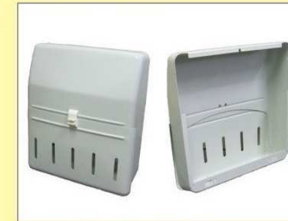
郵便受箱(両面フラッシュ用) KD-2S型(ハネなし) ¥13,600 (アイボリーホワイト)(ブロンズ) アイボリー ¥13,600 ブロンズ ¥16,600