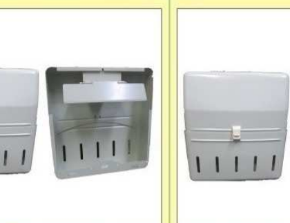
郵便受箱(両面プレス用) KD-3S型 ¥23,600 (アイボリーホワイト)