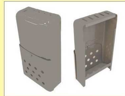
郵便受箱(両面フラッシュ用) KD-1型 グレー ¥14,600 (グレー)(クリーム) (ハネなし) クリーム ¥16,600