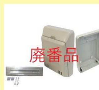
郵便受箱(両面フラッシュ用) KD-5B型 (アイボリーホワイト) (ブラウン) 廃番品