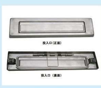
KD-1B型用投入口 (SUS・HL) (SUS・ブロンズ) HL ¥5,000 ブロンズ ¥5,500