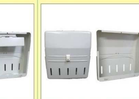
郵便受箱(片面プレス用) KD-3AS型 ¥23,600 (アイボリーホワイト)