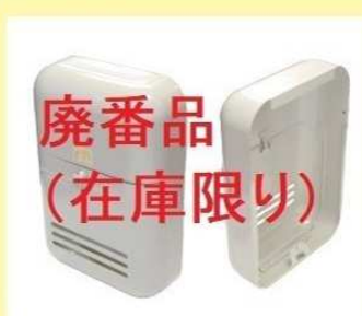
郵便受箱(両面フラッシュ用) KD-6A型 ¥18,500 (代替品)KD-6A改型 → ¥18,000