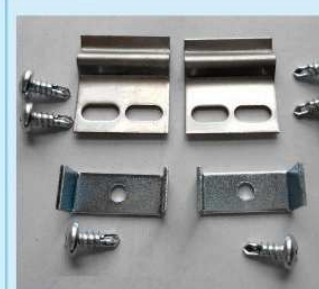
後付用止め金(両面フラッシュ用) 後付用止め金(両面プレス用) ¥2,500