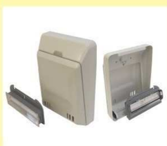
郵便受箱(両面フラッシュ用) KD-5型(セット) (アイボリーホワイト) (ブラウン) ¥22,600