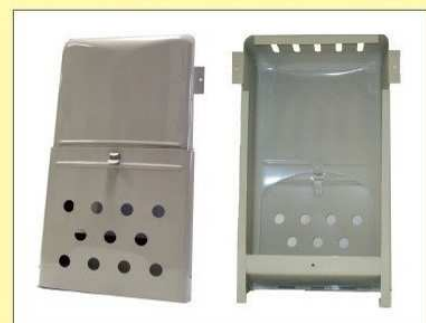
郵便受箱(両面フラッシュ用) KD-1B型 ¥15,600 (クリーム)(ブロンズ)