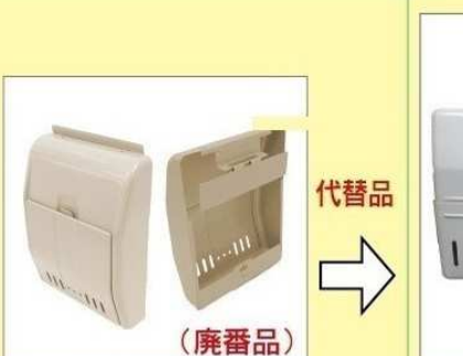
代替品 KJ-3型 《近畿工業(Kinki)製品》 (廃番品)