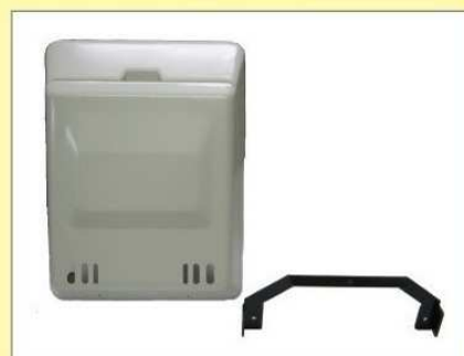
郵便受箱(両面フラッシュ用) KD-1B5型 ¥17,600 (アイボリーホワイト)(ブラウン)