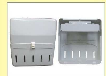
郵便受箱(両面プレス用) KD-2B改S型 ¥23,600 (アイボリーホワイト)