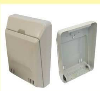
郵便受箱(両面フラッシュ用) KD-5A型 (アイボリーホワイト) (ブラウン) ¥17,100