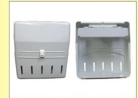
郵便受箱(両面プレス用) KD-2AS型 ¥23,600 (アイボリーホワイト)