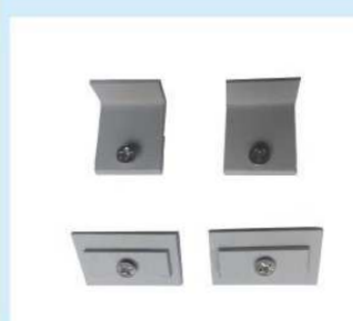
後付け用止め金 (片面プレス用) ¥2,500