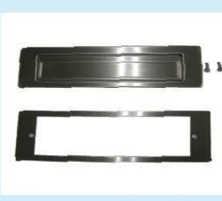
KD-6A改型投入口及びプレート (SUS・HL) (SUS・ブロンズ) HL ¥10,000 ブロンズ ¥12,000