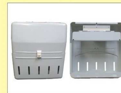
郵便受箱(両面プレス用) KD-2BS型 ¥23,600 (アイボリーホワイト)