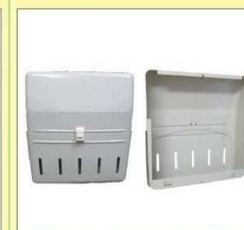
郵便受箱(両面フラッシュ用) KD-3S型(ハネなし) ¥22,600 (アイボリーホワイト・ブロンズ)