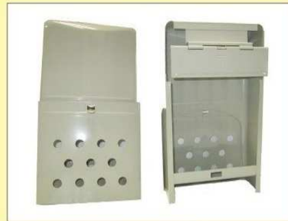
郵便受箱(両面プレス用) KD-1A型 ¥20,600 (クリーム)