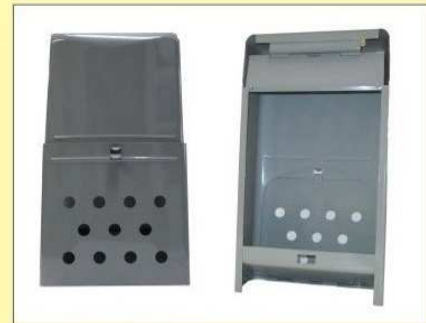
郵便受箱(片面プレス用) KD-1型 グレー ¥15,600 (グレー)(クリーム) クリーム ¥17,600