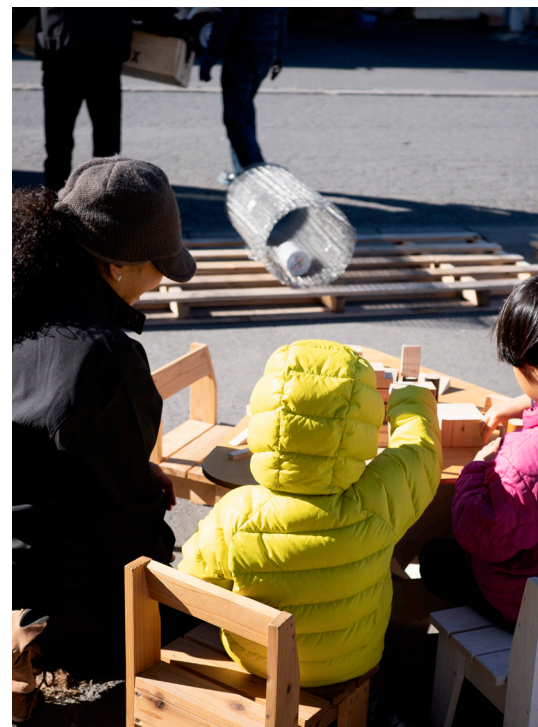
子ども連れでも安心な木育