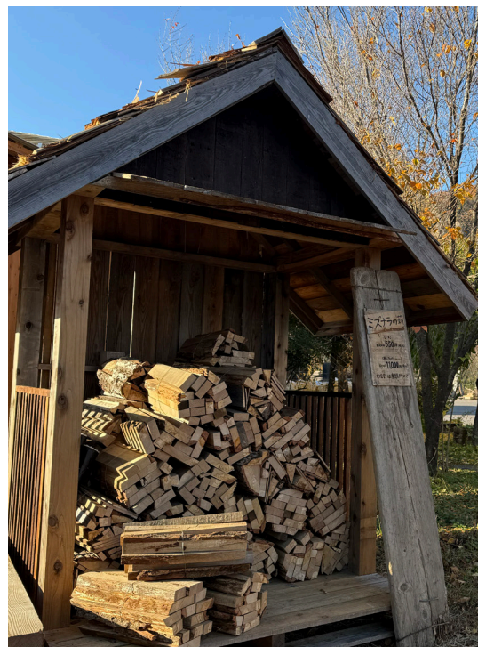
製造部お手製!端材を利用した薪小屋!