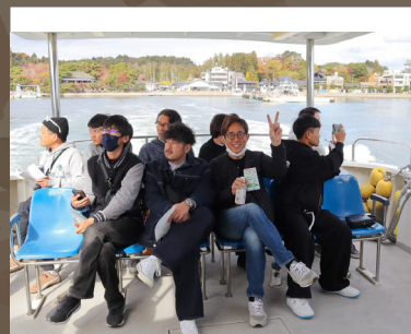
貸切の遊覧船で景色を満喫