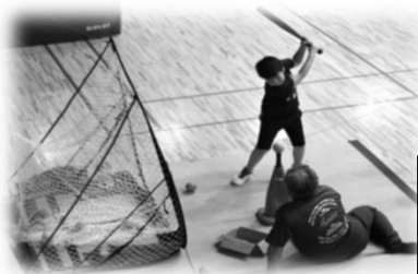
軟式野球 ソフトボール