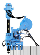
■名称：サイレントパイラー F111 ■メーカー名：(株)技研製作所 ■台数：2台