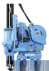
■名称：サイレントパイラー SCU-ECO400S ■メーカー名：(株)技研製作所 ■台数：1台