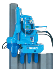
■名称：サイレントパイラー ECO100-3C ■メーカー名：(株)技研製作所 ■台数：1台