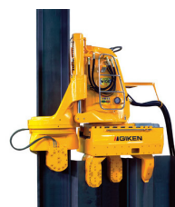
■名称：サイレントパイラー SW100 ■メーカー名：(株)技研製作所 ■台数：1台