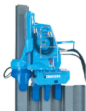
■名称：サイレントパイラー ECO100-3C ■メーカー名：(株)技研製作所 ■台数：1台