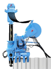
■名称：サイレントパイラー F111 ■メーカー名：(株)技研製作所 ■台数：2台