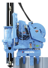
■名称：サイレントパイラー SCU-ECO400S ■メーカー名：(株)技研製作所 ■台数：1台