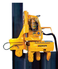
■名称：サイレントパイラー SW100 ■メーカー名：(株)技研製作所 ■台数：1台