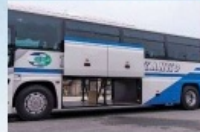
音学仕様の人気60席タイプもご準備しております。