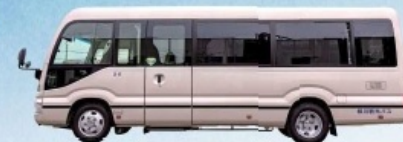
3列席、4列席タイプがございます。