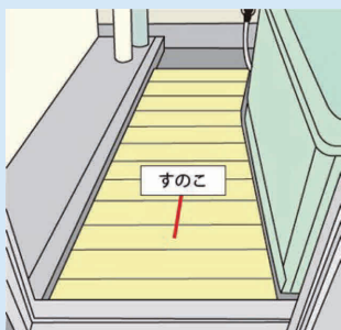
※すのこ設置イメージ

※浴槽の高さ(またぎ口)に影響が出る可能性があります。また蛇口や棚などの位置が相対的に変わりますので、注意が必要です。