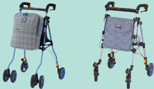
ヘルシーワンW (P95) レジェールキャンシット (P95)