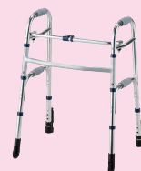
セーフティーアームウォーカー Cタイプ(P93)