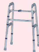
セーフティーアーム ウォーカー・スリム(P93)