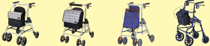
テイコプリトル (P96) テイコプリトルハイⅡ (P95) テイコプリトルスリム (P96) セーフティーアーム ローレタポケット(P97)