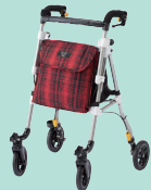
ヘルシーワンレジェール (P95)