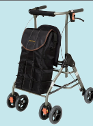
テイコプリトルボンベ(P101)