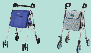
ヘルシーワンキャンシット・ ヌーボー(P95) ヘルシーワンライト カラフル(P95)