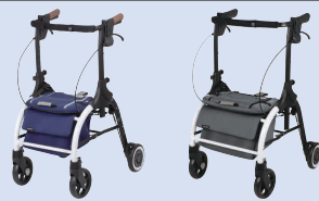
ジスタ(P99) ジスタワイド(P99)