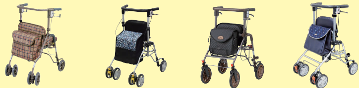
シンフォニーSP(P96) シンフォニーSPスリム(P96) アイルウォークα(P96) アイルウォークライト(P96)