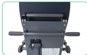
移動しやすい大きなハンドル