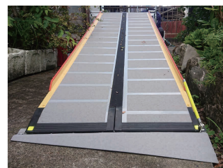
※設置イメージです。

地面とのすき間に傾斜補正台を敷くことで勾配のある場所でも安心して設置可能になります。4～6cmまで高さ調整可能です。