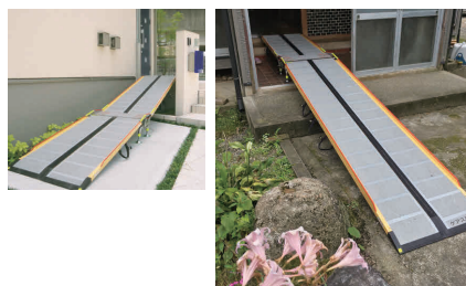
※設置イメージです。

ジョイント台を使用することで、玄関ポーチ等にある多段差を解消できます。様々な住環境に対応し、緩やかな傾斜を実現します。