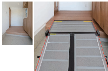
※設置イメージです。

玄関のあがりかまちが斜めでも、「斜め上がり框補正台」を置くことで設置可能になります。かまちの高さは18cm～30cmまで対応可能です。