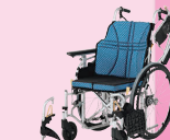
ウルトラモジュールタイプ (自走) (P42)