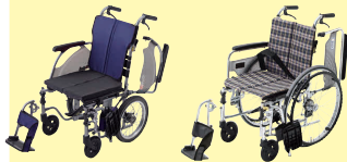
カルッタ (自走・介助) (P41・47)