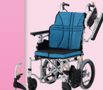
ウルトラモジュールタイプ (介助) (P48)