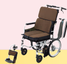
エアフィットズ・スタンダード (自走・介助) (P47)