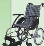
WAVIT (ウェイビット) (介助) (P45)