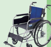
BAL (バル) (自走) (P39)