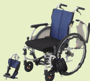
ノンバックブレーキ付 車いす (P40)