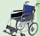
BAL (バル) (介助) (P45)