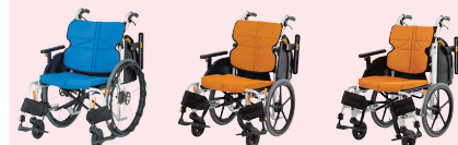
ネクストコアワイド (P44)