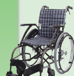
WAVIT (ウェイビット) (自走) (P39)