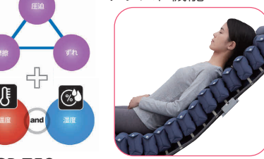
背上げ角度・時間管理アシスト機能

厚さ15cm 83cm幅 90-91cm幅 ショートサイズ有 重量:6.5(6.8)kg