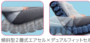
傾斜型2層式エアセル×デュアルフィットセル

厚さ12cm 83cm幅 90-91cm幅 ショートサイズ有 重量:7.7(8.1)kg