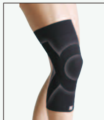
208B-06 すっきり フィットヒザ 369116