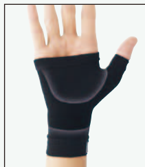
208B-11 すっきり フィット親指・手のひら 369134

●サイズ(cm) / 手首の太さ S:13~15, M:15~17, L:17~19