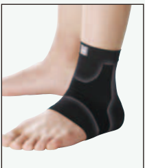
208B-08 すっきり フィット足首 369117

●サイズ(cm) / 足首の太さ S:17~20, M:19~23, L:22~25, ふくらはぎの太さ S:28~34, M:32~38, L:36~42