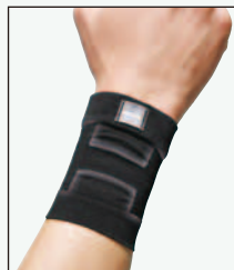
208B-10 すっきり フィット手首 369119

●サイズ(cm) / 上腕の太さ S:22~25, M:25~28, L:28~31, LL:31~34