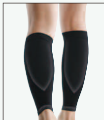
208B-07 すっきり フィットふくらはぎ 369120

●サイズ(cm) / 太ももの太さ S:34~40, M:40~46, L:46~52, LL:52~58 ※お皿の中心から10cm上を計測