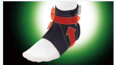
208B-05 しっかりガード 足首 369115