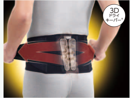
208B-02 しっかりガード 腰 アクティブ 369111