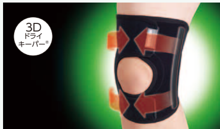
208B-03 しっかりガード ヒザ 369151