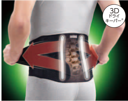
208B-01 しっかりガード 腰 スタンダード〈ブラック〉 369108