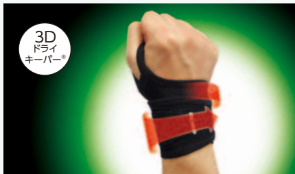
208B-04 しっかりガード 手首 369146