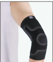
208B-09 すっきり フィットヒジ 369118

●サイズ(cm) / 足首の太さ S:17~20, M:20~23, L:23~26