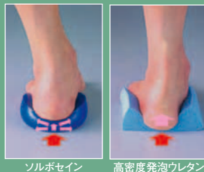
ソルボセイン 高密度発泡ウレタン