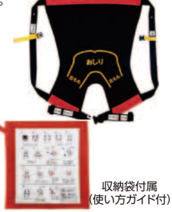
収納袋付属 (使い方ガイド付)

●サイズ/大人用フリーサイズ ●重量/800g ●材質/内部布=ポリエステル、ベルト=ポリエステル、バックル=ポリアセタール、外部カバー=難燃ポリエステル ●耐荷重/150kg (在) ハッピーおがわ