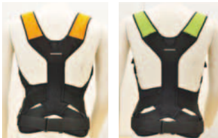
オレンジ(Mサイズ) グリーン(Lサイズ)