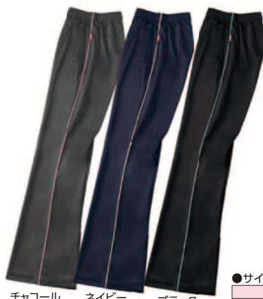
チャコール ネイビー ブラック