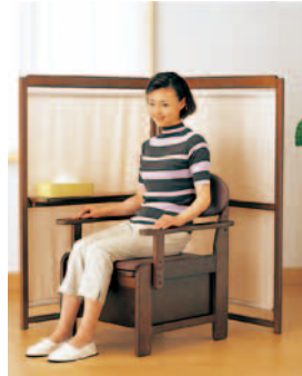
※片側に小物が置ける便利なテーブル付。(在) キンタロー