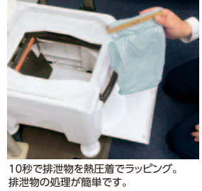
10秒で排泄物を熱圧着でラッピング。排泄物の処理が簡単です。