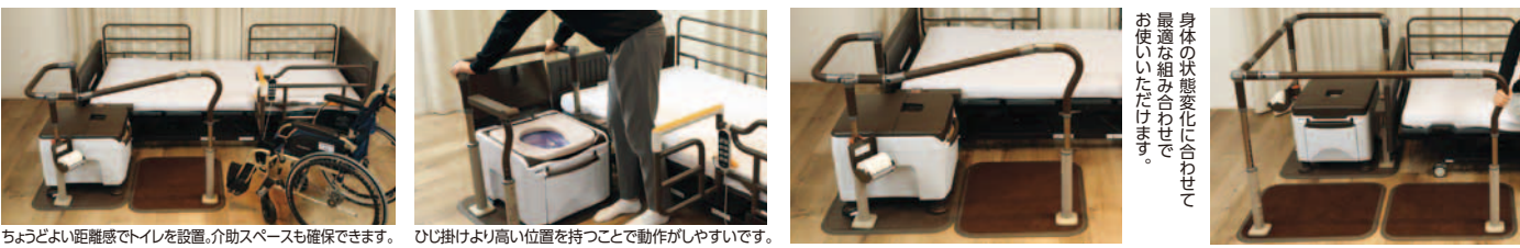
ちょうどよい距離感でトイレを設置。介助スペースも確保できます。 ひじ掛けより高い位置を持つことで動作がしやすいです。