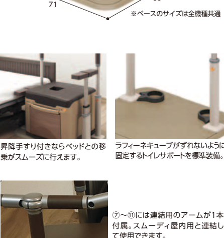
昇降手すり付きならベッドとの移乗がスムーズに行えます。 ラフィーネキューブがずれないように固定するイレサポートを標準装備。 ⑦～⑩には連結用のアームが1本付属。スムーディ屋内用と連結して使用できます。

※ラフィーネキューブ以外のポータブルトイレとは組み合わせるご使用できません。 ※⑦～⑩の片側アームは①～⑥(※③除く)に連結用のアームが1本付属した仕様になります。(スムーディ屋内用と連結して使用できます)