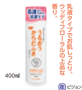
400ml (在) ピジョン