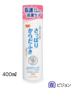
400ml (在) ピジョン