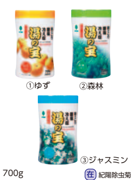
700g (在) 紀陽除虫菊