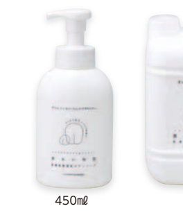
450ml 3.8ℓ (在) ハクソウメディカル