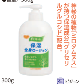
300g (在) ピジョン