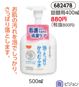
500ml (在) ピジョン