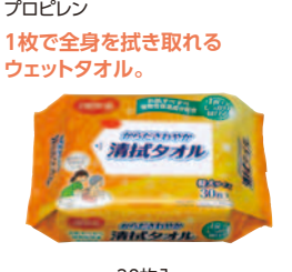
30枚入 (在) ピジョン