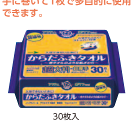
30枚入 (在) 日本製紙クレシア