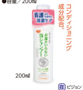
200ml (在) ピジョン