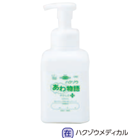
(在) ハクソウメディカル