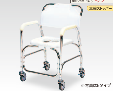
車輪ストッパー ※写真はEタイプ 日進医療器