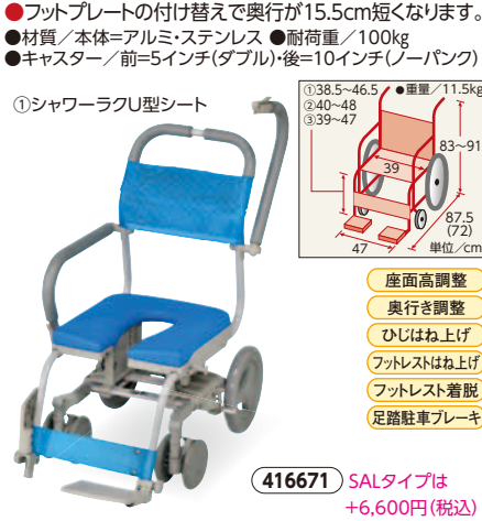
①シャワーラクU型シート ①38.5-46.5 ②40-48 ③39-47 ●重量/11.5kg 座面高調整 奥行き調整 ひじはね上げ フットレストはね上げ フットレスト着脱 足踏駐車ブレーキ 睦三