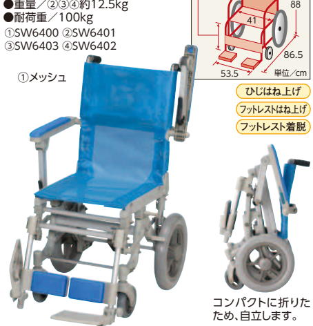
①メッシュ ひじはね上げ フットレストはね上げ フットレスト着脱 コンパクトに折りたため、自立します。 睦三