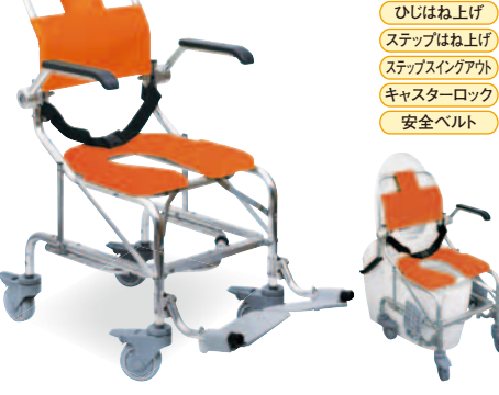
ひじはね上げ ステップはね上げ ステップスイングアウト キャスターロック 安全ベルト 睦三