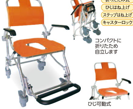
折りたたみ式 ひじはね上げ ステップはね上げ キャスターロック コンパクトに折りたため自立します ひじ可動式 睦三