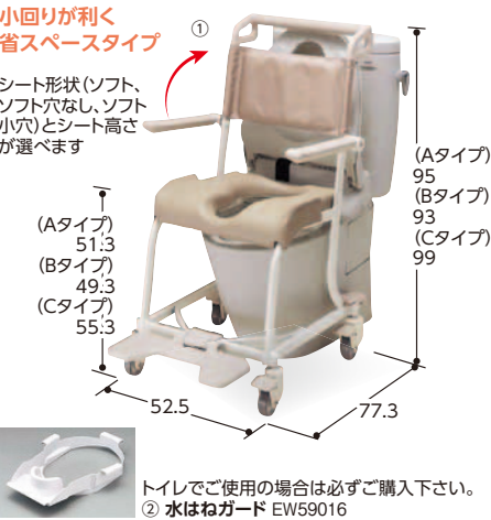
シート形状(ソフト、ソフト穴なし、ソフト小穴)とシート高さが選べます トイレでご使用の場合は必ずご購入下さい。 ②水はねガード EW59016 TOTO