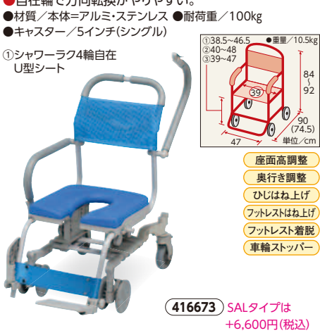
①シャワーラク4輪自在U型シート ①38.5-46.5 ②40-48 ③39-47 ●重量/10.5kg 座面高調整 奥行き調整 ひじはね上げ フットレストはね上げ フットレスト着脱 車輪ストッパー 睦三