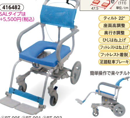
①416482 SALタイプは+5,500円(税込) ティルト22° 座面高調整 奥行き調整 ひじはね上げ フットレストはね上げ フットレスト着脱 足踏駐車ブレーキ 簡単操作で楽々チルト 睦三