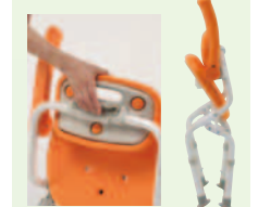
介助しやすいひじかけ(①~⑧⑭)