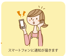
スマートフォンに通知が届きます