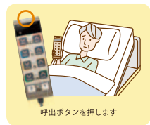
呼出ボタンを押します