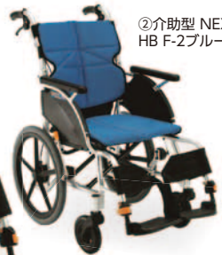
②介助型 NEXT-21B HB F-2ブルー