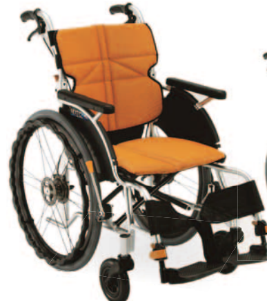
①自走型 NEXT-11B HB F-1オレンジ