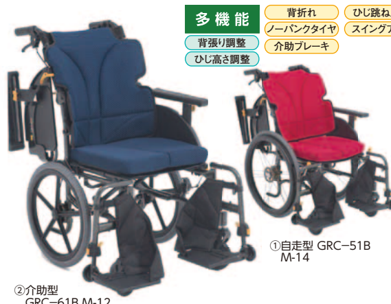
①自走型 GRC-51B M-14