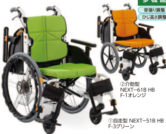
①自走型 NEXT-51B HB F-3グリーン