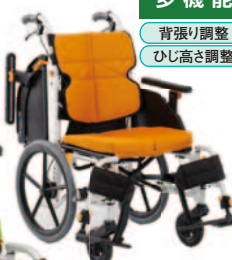
②介助型 NEXT-61B HB F-1オレンジ