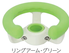
リングアーム・グリーン