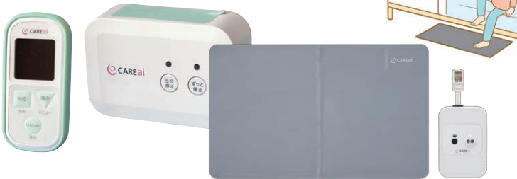
ふむふむセンサー(Sサイズ)