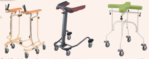
らくらくウォーカー (6輪) (P101) 室内用歩行器 パノラ (P101) アルコークローバーG (P101)