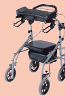
ラビット歩行補助車 (P100)