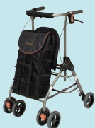
テイコブリトル ポンベ (P101)