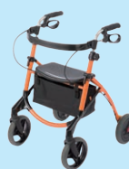
U WalkerII (P99)