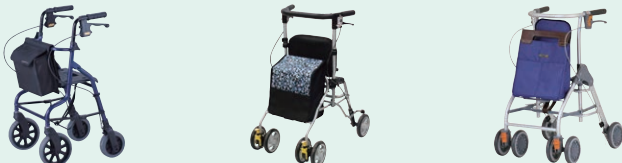
セーフティーアーム ロレータポケット (P97) シンフォニーSP スリム (P96) テイコブリトル スリム (P96)