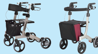
コンパル (P99) リトルターン 抑速付き (P99)