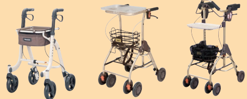
スムーディ (室内用)カジサポ (P94) テイコブリトル ホーム (P94) テイコブリトル ホームF (P101)