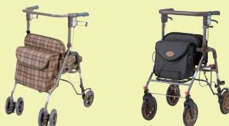
シンフォニーSP (P96) アイルウォークα (P96)