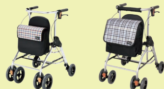
テイコプリトル (P96) テイコプリトル ハイII(P95)