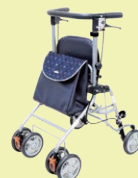
アイルウォークライト (P96)