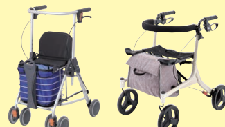
テイコプリトル ワゴン(P98) ショッピング ターン(P98)