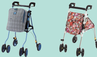
ヘルシーワンW (P95) ピューレストマム (P95)