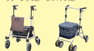
スムーディ(買物用) カウサポ(P98) シンフォニー スリムBOX (P98)