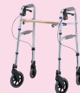
セーフティーアーム Vタイプウォーカー(P94)