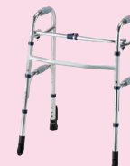
セーフティーアーム ウォーカーCタイプ(P93)