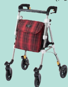
ヘルシーワンレジェール (P95)