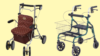
シンフォニー ラクーン(P98) セーフティーアームロータ SPタイプ(P98)