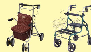
シンフォニー ラクーン(P98) セーフティーアームロータ SPタイプ(P98)