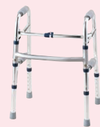
セーフティーアーム ウォーカーSS(P93)