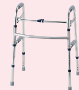
セーフティーアーム ウォーカー(P93)