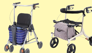
テイコプリトル ワゴン(P98) ショッピング ターン(P98)