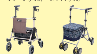
スムーディ(買物用) カウサポ(P98) シンフォニー スリムBOX (P98)