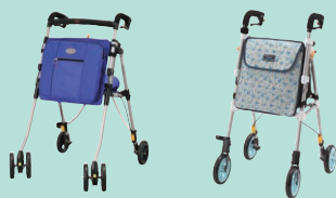
ヘルシーワンキャンシット ヌーボー(P95) ヘルシーワンライト カラフル(P95)