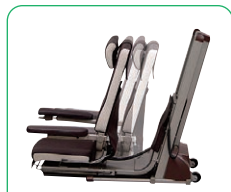
前後スライドストローク16.5cm