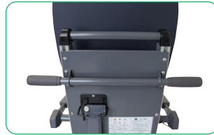
移動しやすい大きなハンドル