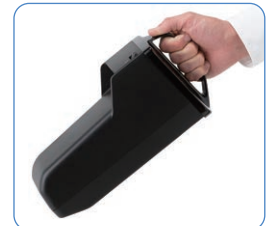
バッテリーを外して充電可