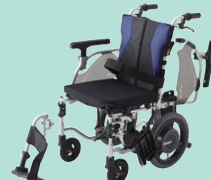
ミライト・ウィング (P53)