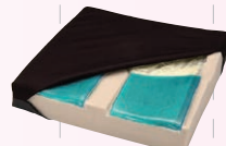
デュオジェル クッション