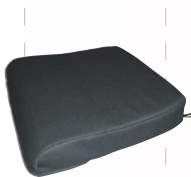
エルダー クッション