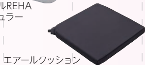
エアールクッション