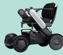
WHILL Model CK2 (P54)