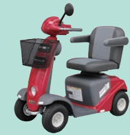
マイピアスマート (P55)