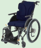
グレイスコア (自走) (P39)