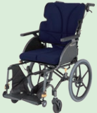
グレイスコア (介助) (P45)