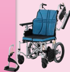
ウルトラモジュールタイプ (介助)(P48)