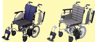
カルッタ(自走・介助) (P41-47)