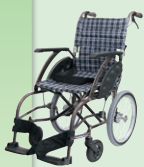
WAVIT(ウェイビット) (介助)(P45)