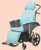
フルリクライニング車椅子 (P50)