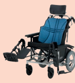
ウルトラティルト& リクライニング(P52)