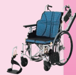
ウルトラモジュールタイプ (自走)(P42)