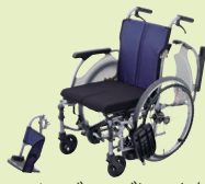
ノンバックブレーキ付 車いす(P40)