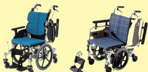
ネクストコアくるり (自走・介助) (P43-49)