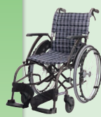
WAVIT(ウェイビット) (自走)(P39)