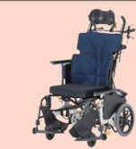
マイチルトコンパクトII (P51)