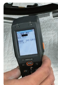
バーコードによる商品管理

洗浄・消毒・点検を終えた福祉用具は、水やほこりが入らないようビニールに梱包しバーコードで管理され、清潔室で大切に保管いたします。