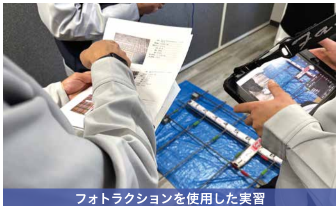
フォトラクションを使用した実習

実際の現場で使う機材や知識を学んでもらい、建設業界や当社への理解を深めていただきました。現場の先輩方に直接質問をしたり働いている様子を見て、目を輝かせていました。