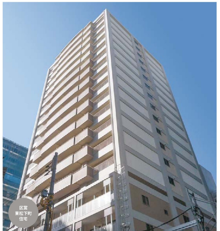
区営 東松下町 住宅