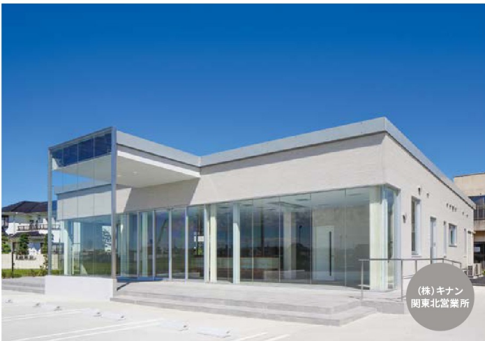
(株)キナン 関東北営業所