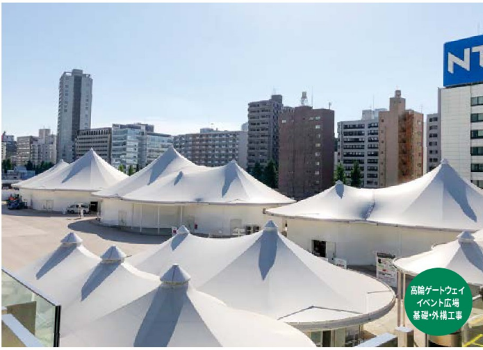
高輪ゲートウェイ イベント広場 基礎・外構工事