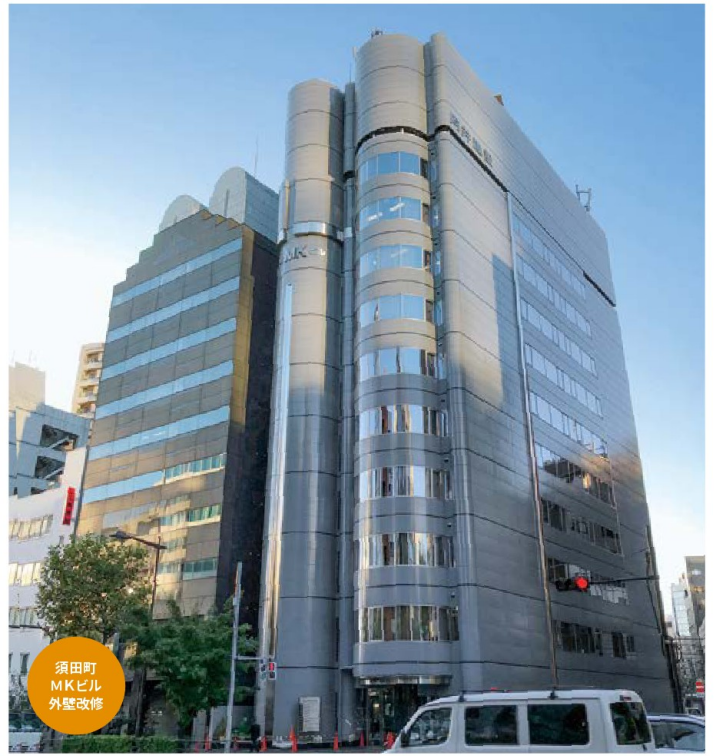
須田町 MKビル 外壁改修