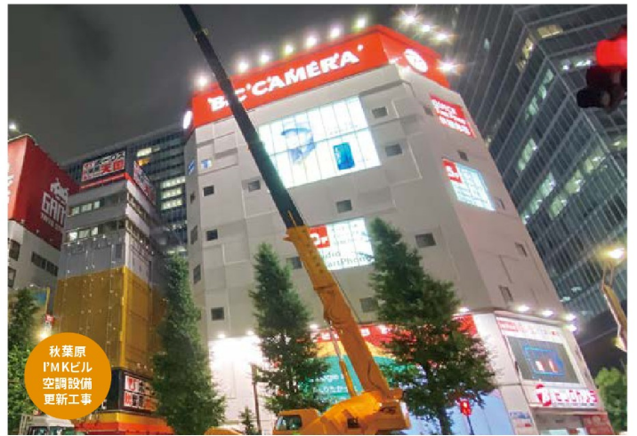
秋葉原 PMKビル 空調設備 更新工事