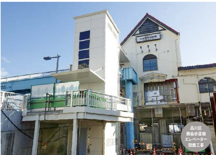
品川区 勝島歩道橋 エレベーター 設置工事