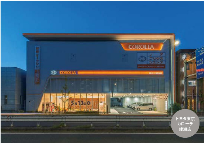
トヨタ東京 カローラ 綾瀬店