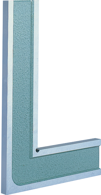
1級 (焼入) 2級 (焼入)