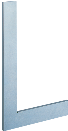
■寸法図 (概略) 単位: mm