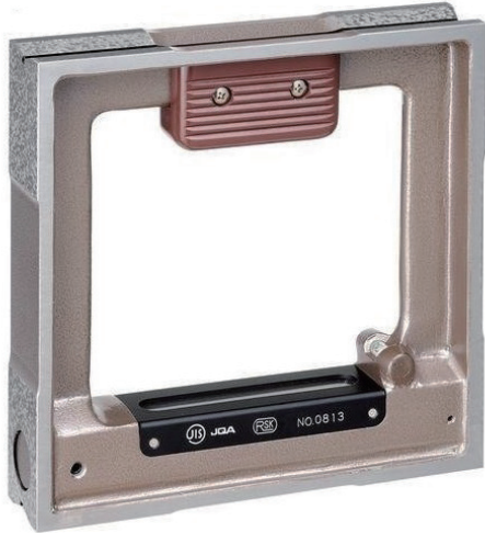
JIS A 級