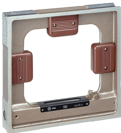
JIS A 級 AA (社内規格)