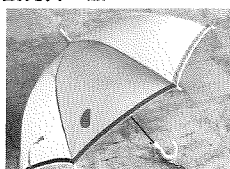
赤い羽根マーク入り 黄色い傘