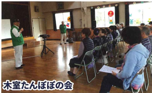
木室たんぽぽの会

現在、大川市では各校区を単位とした小地域での支え合いのしくみづくりを推進しています。その中で先進的に取り組みを行っている木室校区・田口校区について紹介いたします。