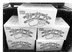
高齢者施設見舞い品

※歳末たすけあい募 金の残額につい ては、令和2年度社 協配分額へ繰り入 れさせていただ きます。