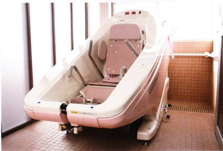
■機械浴(ソファバス)

車いすの人にも使いやすい構造。ご利用者様の清潔で安全な生活を大切にしたい設備は、ご家族様にも納得いただけます。