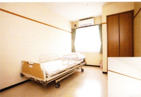
■有料老人ホーム個室(冷暖房完)