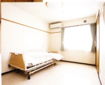
■グループホーム個室(冷暖房完)

木造平屋建ての建物をご利用なさる方にやさしく、安全で便宜性に優れた設計となっており、広い空間の中でゆったりとした時間が過ぎて行きます。