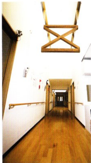
■日差しが差し込む廊下

ご利用者のやすらぎとゆとりを第一に考えた生活環境は、きっと毎日の暮らしに安心と笑顔があふれます。