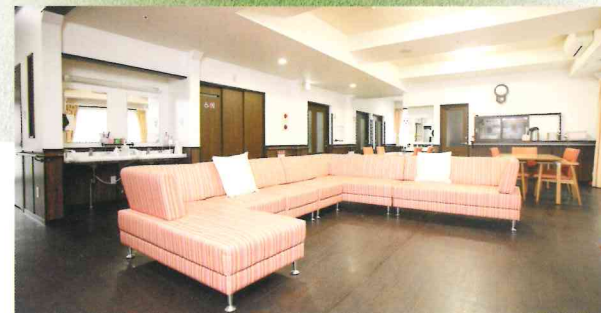
西棟 楽々 デイルーム ソファ等の家具をオレンジを基調とした色で統一し、暖かな雰囲気でお過ごしいただけます。