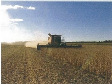
大豆の収穫 9月末～10月