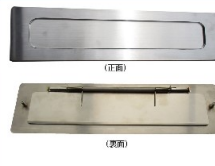
KD-3S型用投入口 (SUS・HL) ¥18,000