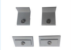
後付け用止め金 (片面プレス用) ¥2,500