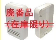
KD-6A型: 廃番品 (代替品) KD-6A改型 ⇒アイボリーホワイト/ブラウン ¥16,500