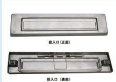
KD-1B型用投入口 (SUS・HL) (SUS・ブロンズ) SUS・HL ¥6,500 ブロンズ ¥9,000