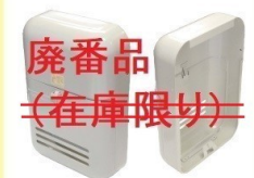
KD-6A型: 廃番品 (代替品) KD-6A改型 ⇒アイボリーホワイト/ブラウン ¥16,500