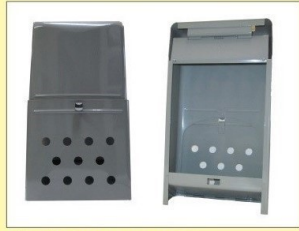
郵便受箱 (片面プレス用) KD-1型ハネ有り グレー ¥15,100 クリーム ¥17,100