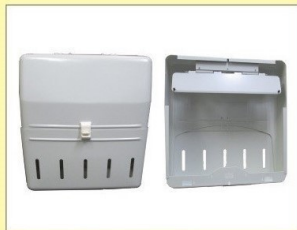
郵便受箱 (片面プレス用) KD-2S型ハネ有り アイボリーホワイト ¥30,600