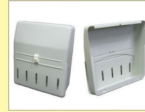
郵便受箱 (両面フラッシュ用) KD-2S型ハネ無し アイボリーホワイト ¥15,000