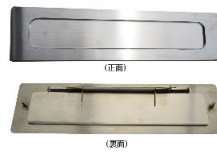
KD-3S型用投入口 (SUS・HL) ¥18,000