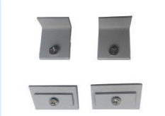
後付け用止め金 (片面プレス用) ¥2,500