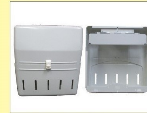
郵便受箱 (両面プレス用) KD-2B改S型 アイボリーホワイト ¥30,600