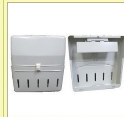
郵便受箱 (片面プレス用) KD-3AS型 アイボリーホワイト ¥30,600