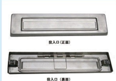
KD-1B型用投入口 (SUS・HL) (SUS・ブロンズ) SUS・HL ¥6,500 ブロンズ ¥9,000