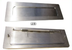
KD-6A改型用投入口 (SUS・HL) ¥16,600