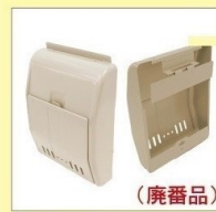
KJ-3型 《近畿工業 (Kinki) 製品》