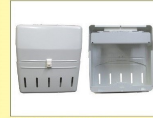
郵便受箱 (両面プレス用) KD-2AS型 アイボリーホワイト ¥30,600