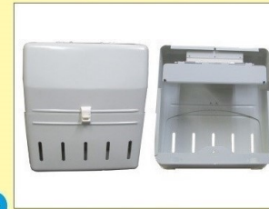
郵便受箱 (両面プレス用) KD-2A改S型 アイボリーホワイト ¥30,600