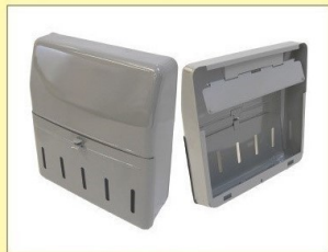
郵便受箱 (片面プレス用) KD-2型 グレー ¥20,600 クリーム ¥21,600