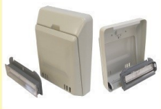
郵便受箱 (両面フラッシュ用) KD-5型 (セット)Bタイプ アイボリーホワイト/ブラウン ¥17,100