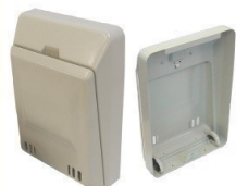
郵便受箱 (両面フラッシュ用) KD-5A型 アイボリーホワイト/ブラウン ¥11,100