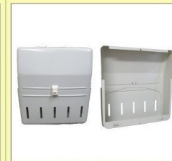
郵便受箱 (両面フラッシュ用) KD-3S型ハネ無し アイボリーホワイト ¥22,600 ブロンズ ¥24,000