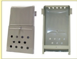
郵便受箱 (両面フラッシュ用) KD-1B型 クリーム/ブロンズ ¥15,100