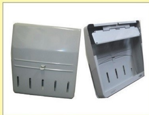
郵便受箱 (片面プレス用) KD-2Y型 グレー ¥22,800