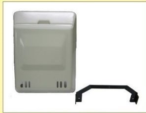
郵便受箱 (両面フラッシュ用) KD-1B5型 アイボリーホワイト/ブラウン ¥21,600