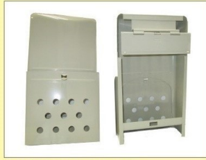
郵便受箱 (両面プレス用) KD-1A型 クリーム ¥18,100