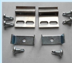
後付用止め金 (両面フラッシュ用) 後付用止め金 (両面プレス用) ¥2,500