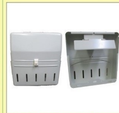
郵便受箱 (両面プレス用) KD-3S型ハネ有り アイボリーホワイト ¥30,600