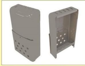
郵便受箱 (両面フラッシュ用) KD-1型ハネ無し グレー ¥13,600 クリーム ¥15,600