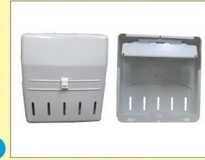
郵便受箱 (片面プレス用) KD-2YS型 アイボリーホワイト ¥30,600