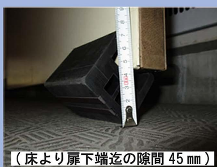
（床より扉下端迄の隙間 45 mm）