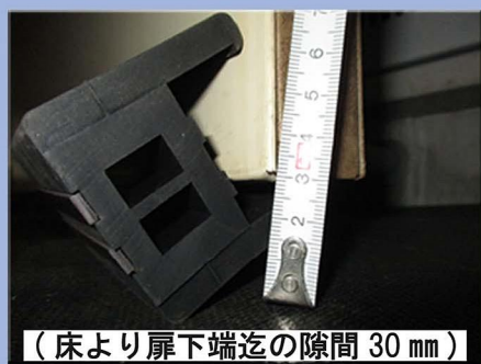
（床より扉下端迄の隙間 30 mm）