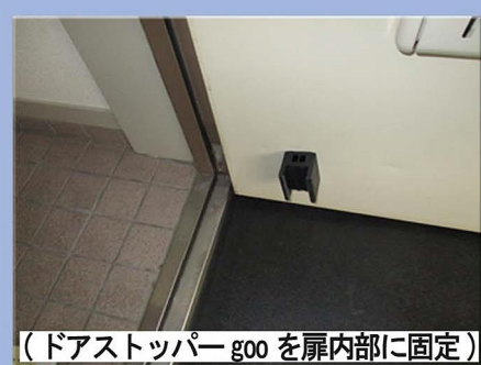
（ドアストッパー goo を扉内部に固定）