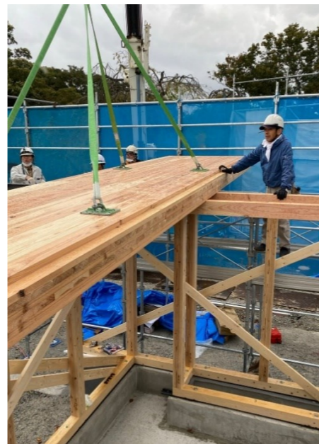
→小諸市動物園施工時の様子です。狭いスペースの中でも正確なクレーンの操作に感服してしまいます。この日はあまり天候に恵まれませんが、何とか雨は降らずに済みました。

CLTはクロスラミネーテッドティンバーの略称で、ひき板（ラミナ）を並べた後、繊維方向が直交するように積層接着した木質系材料です。厚みのある大きな板であり、建築の構造材の他、土木用材、家具などにも使用されています。ここ数年では木造高層ビルに多く利用されています。 現在改装中の「小諸市動物園」の屋根にも、このCLTが使われています。CLT一枚の大きさは3×12メートルもあるため、狭い路地が多い現場に配送するだけでも一苦労でした。これからの高層建築の材料としてますます期待されるCLTですが、狭い道路や、入り組んだ土地への運搬が課題の一つであると感じました。小諸市動物園は来年5月頃リニューアルオープンの予定です。