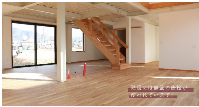
階段には無節の唐松が使われています！

上田市内の新築住宅。先月の11月にお引渡しとなりました。こちらのお宅は一階の床に無垢のオーク、二階の床に地元、信州から松のフローリングを使用しています。撮影した際に驚いたのは、床だけでなく階段材や天井板、ベランダ塀など、あらゆる場所に信州から松を使用している事です。特に存在感のある階段には無垢の（木の節が全くないもの）から松材が使われています。 針葉樹の中でも、杉やヒノキは無節のものが出回っていますが、から松は他の木と比べ節が多く、節の無いものを手に入れるのが難しい木です。それだけこだわりのあるお施主様なんだなあ、と木好き私としては、ほくほくとしたうれしい気持ちになりました。一階の半地下にはポルダリングルームもあり、一日中家で遊んでいられそうです。この素敵なお家で、ご家族が未永く幸せでありますように願っております。