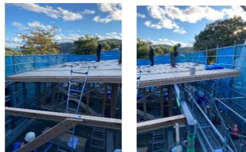
←CLTが大きいせいか、作業する大工さんが小さく見えます。