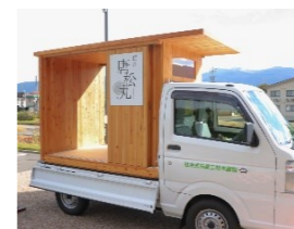
↑齋藤木材工業㈱様の野外展示 信州唐松の集成材「唐松丸」