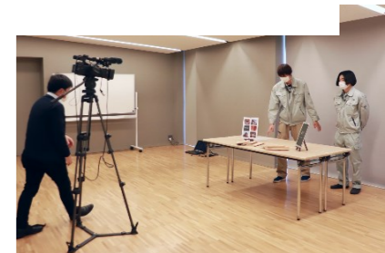
↑オンライン参加者向け県産材製品PR動画の撮影風景。(各社1分)