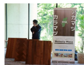
↑テオリアランパーテック様 高耐久天然木「Wolesty Moca」