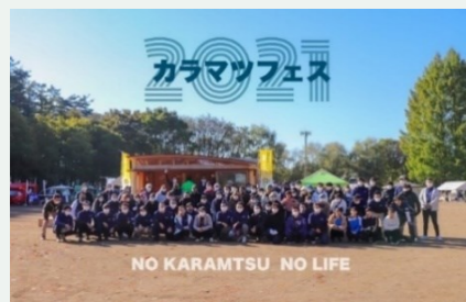
カラマツフェスタ

10月24日（日）、佐久市駒場公園多目的ひろばにて、「カラマツフェスタ2021」が開催されました。佐久市の名産である唐松を地域の人にもっと身近に感じてもらいたい、という想いから生まれたカラマツフェスタ。今回が記念すべき一回目の開催となりました。弊社では「唐松の椅子作り体験」にスタッフがお手伝いとして参加させていただきました。（※台座だけ唐松で他の材は杉です笑）子供たちと一緒に椅子作りで没頭しましたが、木材が硬く全く釘が入らないので、みんな汗だくになりながらも頑張りました！コロナウイルス感染症が収まりつつあるタイミングと重なり、会場は多くの人で賑わっていました。おかげさまで用意した50組の椅子もすべて完売。お断りするご家族もあるほどでした。せっかくなので、来年はもっとお断りしてしまう結果になったので、「来年はもっと用意したいね。」ということで、来年もぜひ開催してほしいです！