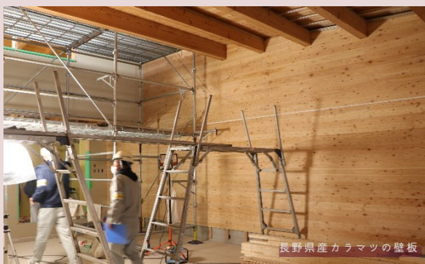
長野県産カラマツの壁板

長野県南佐久郡佐久穂町にある大日向小学校は、1924年にドイツで発祥しオランダで発展した「イェナプラン教育」をベースにした私立小学校です。イェナプランとは、子ども一人ひとりの違いや個性を尊重し、社会で自立しながらも、他者と共生できる人物を育てていくことを目指す教育の考えかたです。2021年6月時点、日本でイェナプランを採用し、専門の機関から認定を受けている小学校は大日向小のみ。イェナプラン教育を子供たちに受けさせたいと、佐久穂町へ移住してくる家族も多く、現在では生徒の76%が移住者です。2022年春には中中部（中学校）が開設される予定です。弊社では大日向中学校建設工事の木仕事を担当させていただきました。安全パトロールの際、現場を訪問しましたので、そちらの様子を掲載いたします。