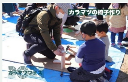
カラマツの椅子作り