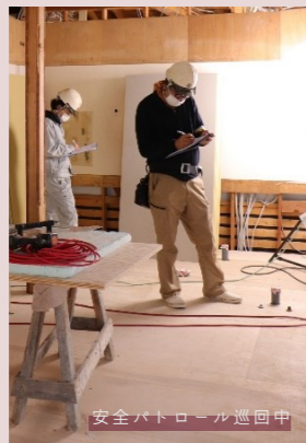
安全パトロール巡回中